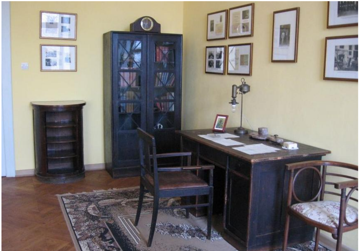
Pracownia poświęcona pamięci Michała Marczaka na zamku w Dzikowie