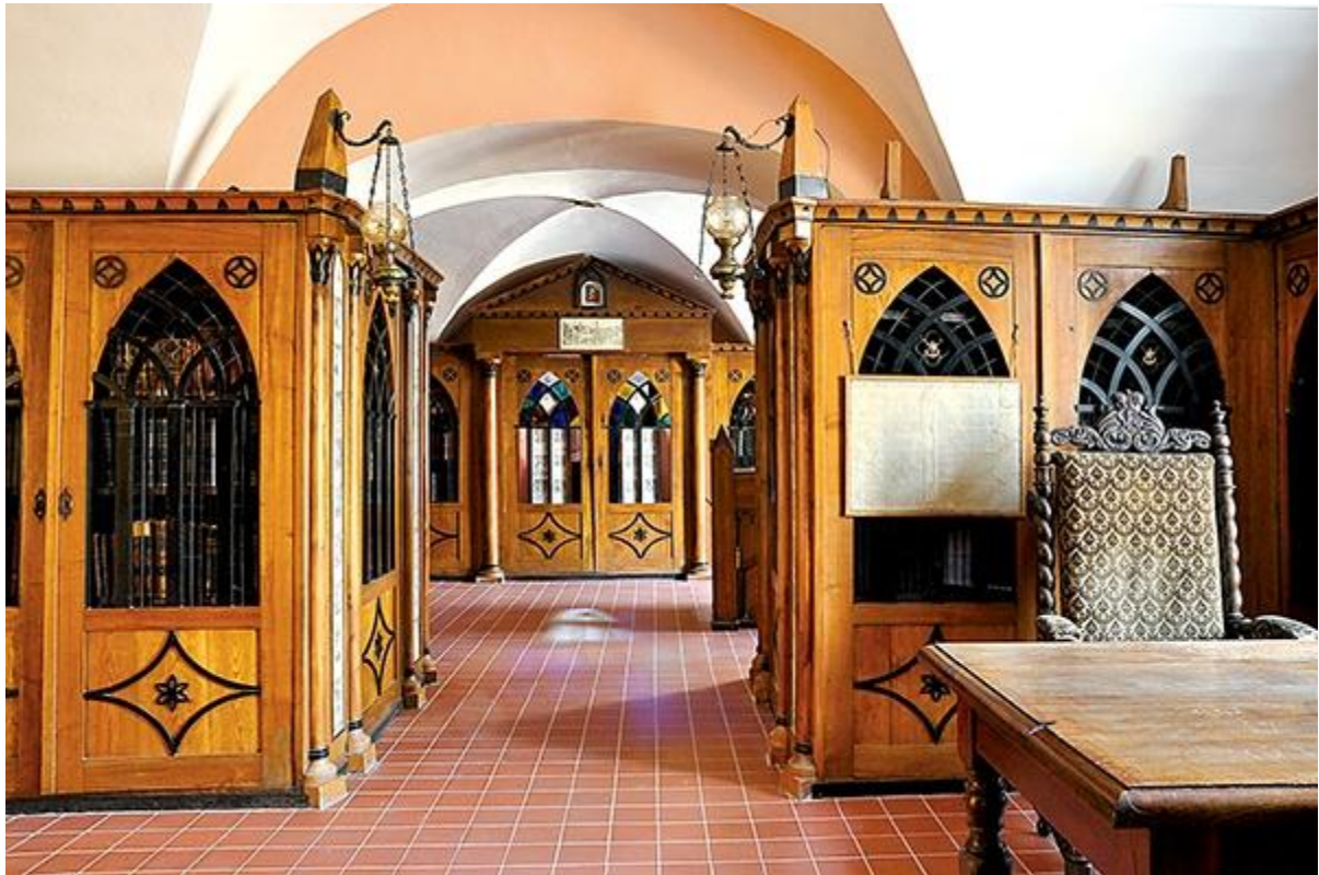
Biblioteka Tarnowskich w Dzikowie