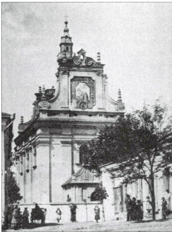
Kościół klasztorny OO. Dominikanów