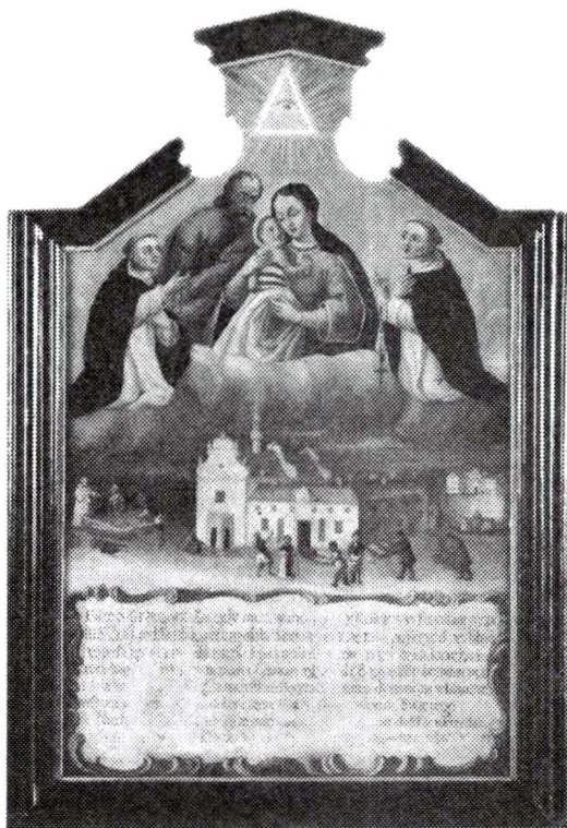
Obraz wotywny z klasztoru OO. Dominikanów

Od chwili założenia klasztoru był on miejscem żywego kultu Matki Boskiej Dzikowskiej. Świadczy o tym choćby książka napisana przez o. Wawrzyńca Święckiego "Wonność Roze Yerychontskiej lubo łaski, dary..." wydana w Krakowie w 1686 roku i opisująca nie tylko historię cudownego obrazu, ale i łaski doznawane przez wiernych za jego sprawą. Na wyjątkowy charakter tego miejsca zwracali też uwagę konfederaci dzikowscy, nawet w tekście roty składanej przed ołtarzem przysięgi.