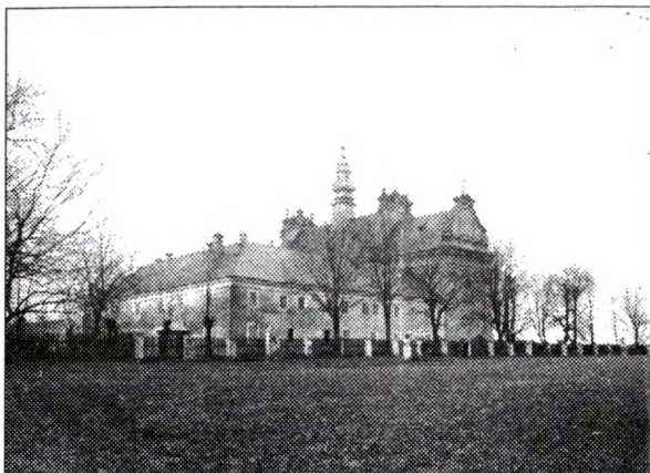
Klasztor OO. Dominikanów w Tarnobrzegu od strony ogrodu

szek Biegański. Wyposażanie świątyni trwało wiele lat. Wspaniały ołtarz główny wypełniający ścianę szczytową prezbiterium, dzieło mistrzów lwowskich, stanął w 1755 roku. Ostatecznie dekorowanie i wyposażanie świątyni zostało ukończone w 1782 roku.