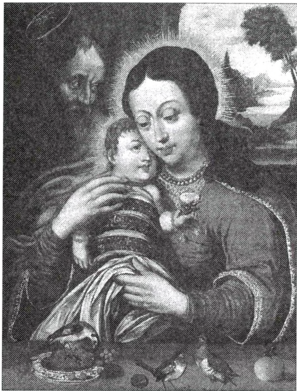
Cudowny obraz Matki Boskiej Dzikowskiej